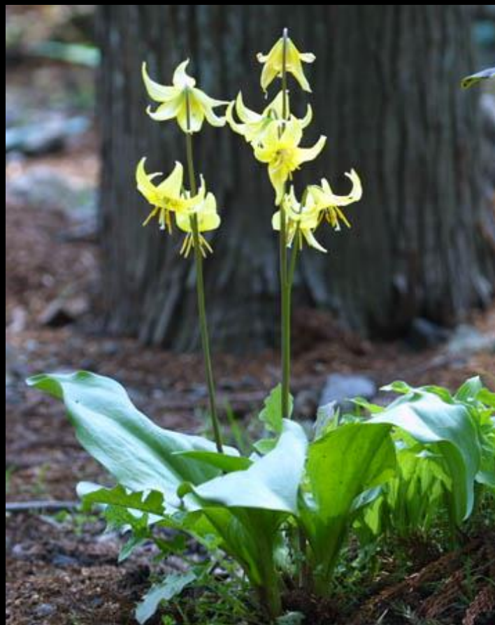
キバナカタクリ(北アメリカ産)