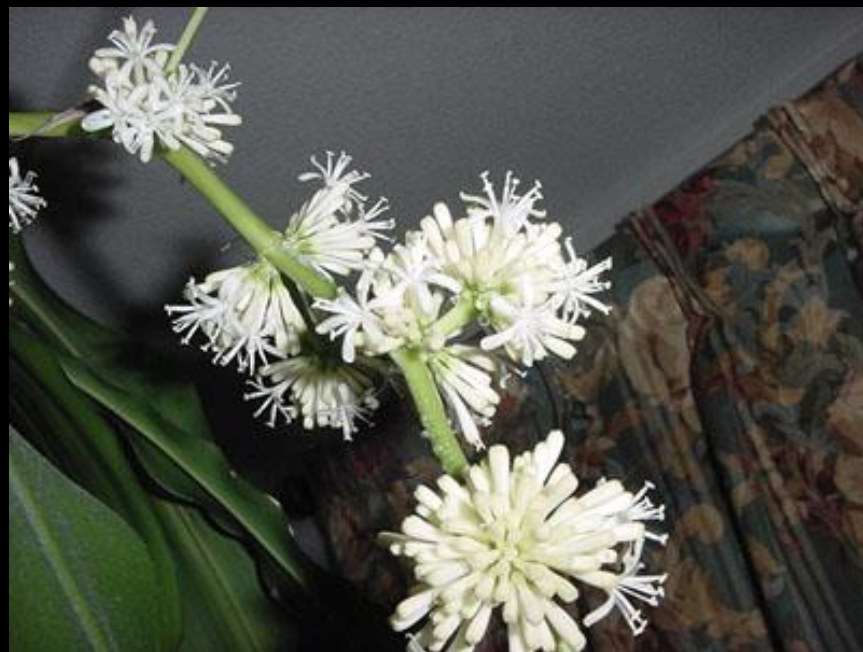
ドラセナ・マッサンゲアナ