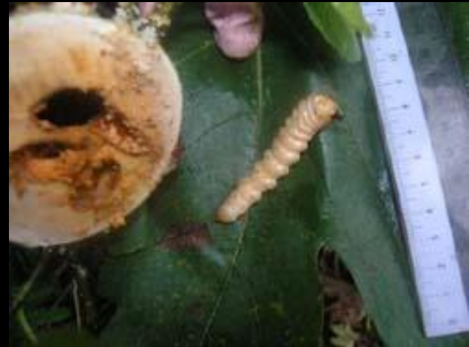
テッポウムシ (カミキリムシの幼虫)