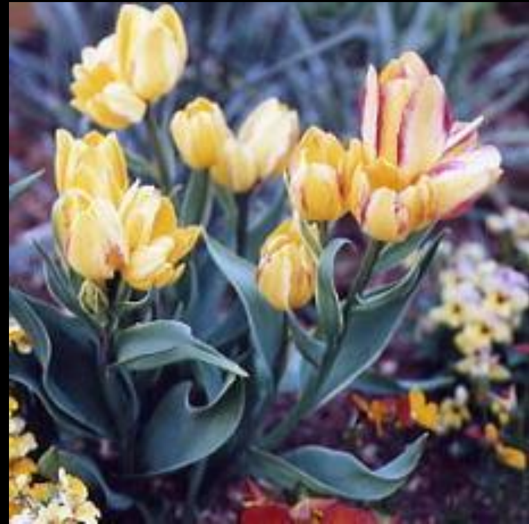
枝咲き系(アントワネット)