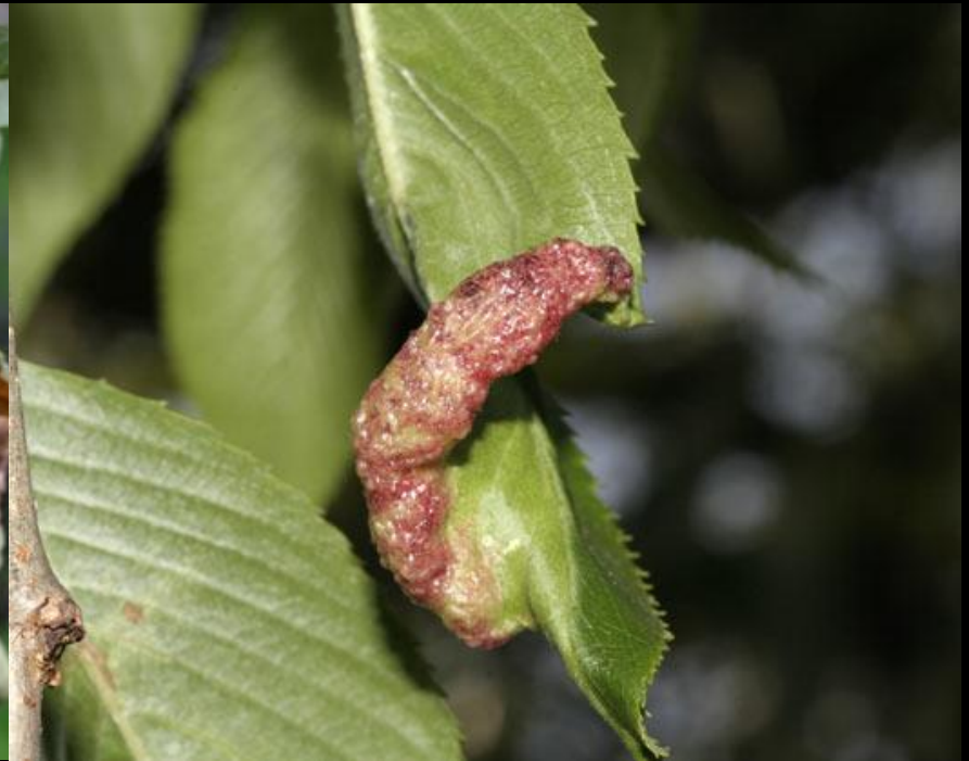
アブラムシの寄生