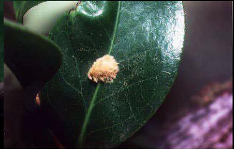
チャドクガの卵塊