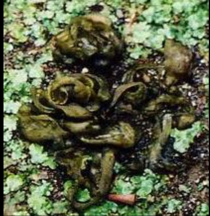
イシクラゲ (藍藻類)